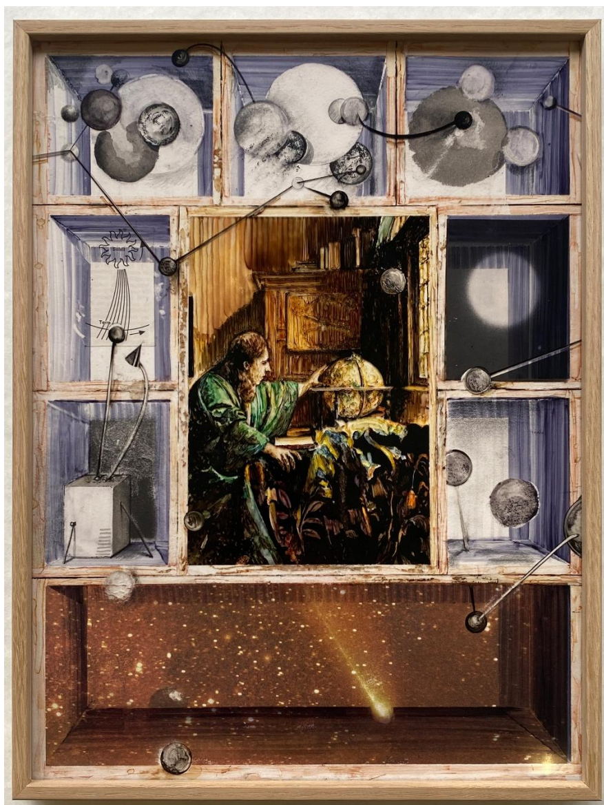
BIBLIOTHEQUES COULEUR-VERMEER, L'ASTRONOME, 2024 40 x 30 cm, Feutre, transfert, graphite, encre, collage sur papier

be@galeriefrancoise.com - + 33.7.88.72.15.68