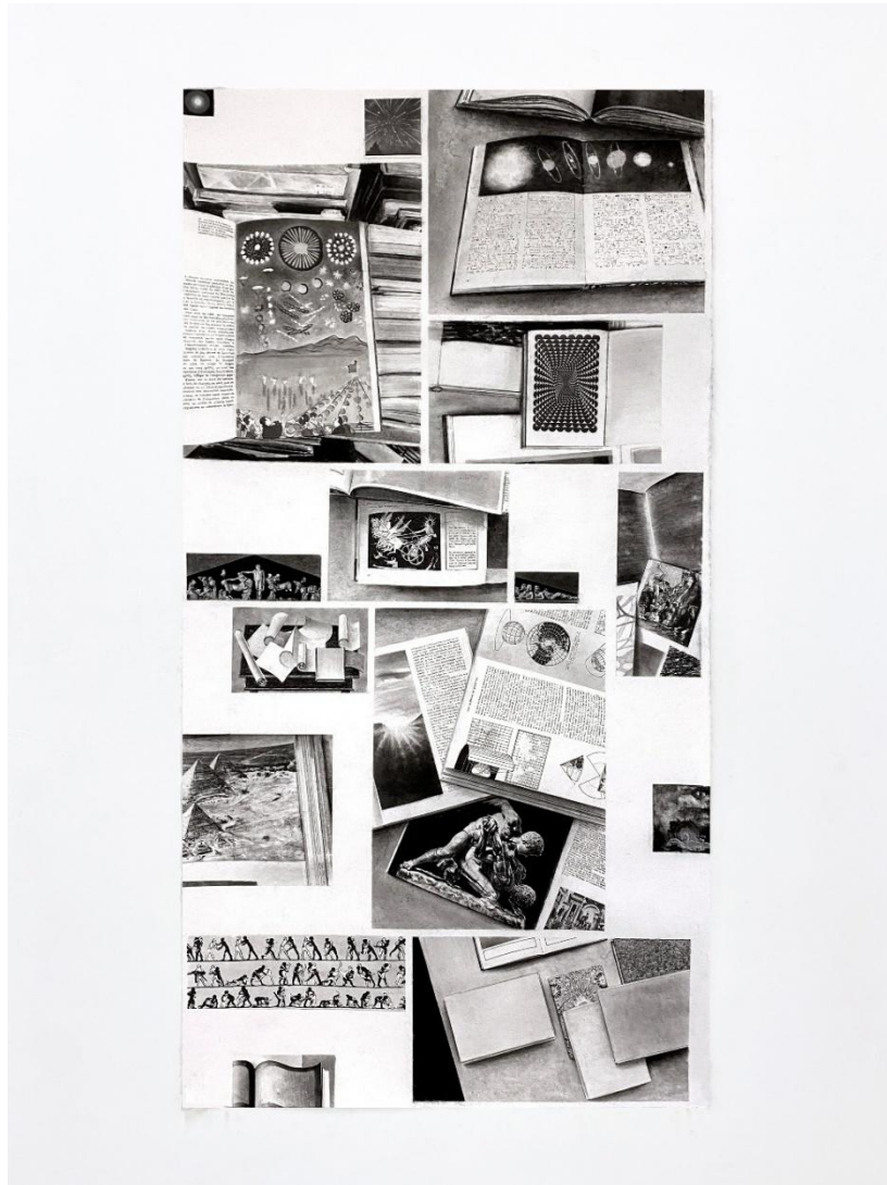
CHAEKGEORI 2 / 책결이 2, 2025 143 x 75 cm, Pastel, pierre noire, graphite et collage

be@galeriefrancoise.com - + 33.7.88.72.15.68