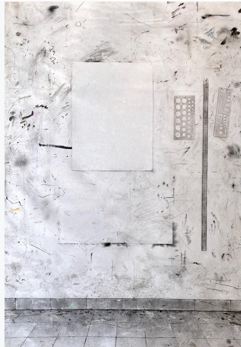
ATELIER 1, 2025

be@galeriefrancoise.com - + 33.7.88.72.15.68