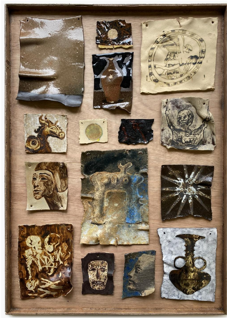
LIBRARY, 2025 60 x 40 cm, Bois, grès et clou

be@galeriefrancoise.com - + 33.7.88.72.15.68