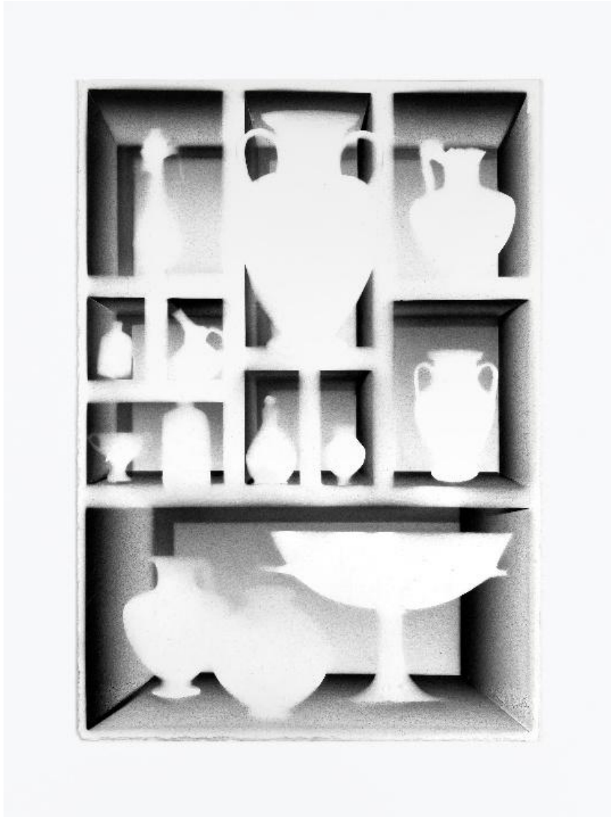
LEPORELLO 3, 2025 28,5 x 20 cm, Aérographe sur papier

be@galeriefrancoise.com - + 33.7.88.72.15.68